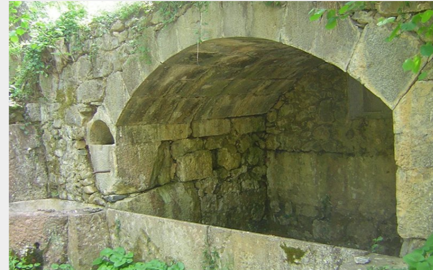
Fontaine de Bize (CCNB)